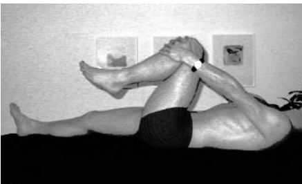
Abb. 6: Basisbewegung 3 Rückenlage, max. Hüftflexion, unilateral links eingeschränkter als rechts