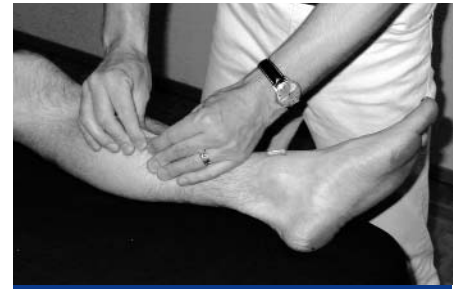
Abb. 13: Hautfaltentest am linken Unterschenkel

Am linken oberen Sprunggelenk des Patienten begann ich mit einem von medial ansetzenden Griff im Hautareal zwischen der Sehne des M. tibialis anterior und dem Malleolus medialis unterhalb vom Retinaculum musculorum extensorum inferior. Wie auf Abbildung 14 zu sehen, setze ich beide Daumen ca. 2-3 cm medial am distalen Tibiaende an. Dann gebe ich steigenden Druck nach inferior medial. Durch den symmetrischen Druck kommt es zu einer Hautfaltenbildung mit mittigen Einziehungen. Ich spürte beim Patienten, wie erwartet, einen festen Gewebswiderstand. Der Patient beschrieb den Druck als hellen, stechenden, tief in das Gelenk einstrahlenden Schmerz. Dieser Schmerz signalisiert jeweils entzündungsbedingte Verklebungen von Kapselgewebe. Nach ca. 15 Sekunden spürte ich eine sich deutlich reduzierende