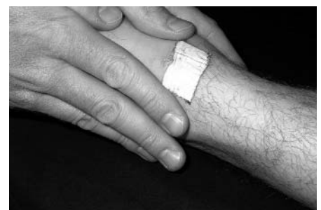
Abb. 10: Hautverschieblichkeitstest linker Fußrücken

Der Verschieblichkeits- und Hautfaltentest liefert Informationen über die Oberflächenspannung des Gewebes. Erhöhte Gewebsspannung der Oberfläche hat Konsequenzen auf tiefere Regionen und umgekehrt. Der Hautverschieblichkeitstest auf dem linken Fußrücken (Abb. 10) und dem distalen Unterschenkel (Abb. 11) ergab ein deutlich festes Endgefühl, wobei die