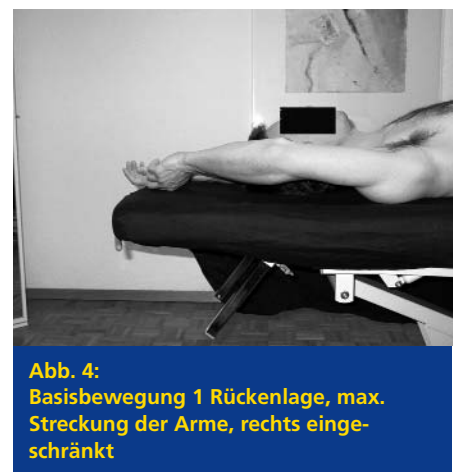
Abb. 4: Basisbewegung 1 Rückenlage, max. Streckung der Arme, rechts eingeschränkt

Maximale passive Flexion der Hüfte. Patient zieht das linke Bein Richtung Brust. Bei 100° Flexion treten starke