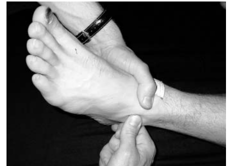
Abb. 9: Translationstest distales Tibiofibulargelenk links

Wie sich bei den Beweglichkeitstests gezeigt hat, war die dorsale Extension des linken oberen Sprunggelenks um