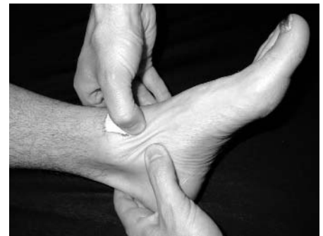
Abb. 14: Frontaltechnik, Kapsel OSG, linker Fuß, medial