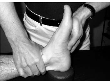
Abb. 8: Translationstest, OSG links

Schmerzen in der linken Leistenengegend auf (Abb. 6). Die rechte Hüfte ist bis maximal 150° beugbar und schmerzfrei.