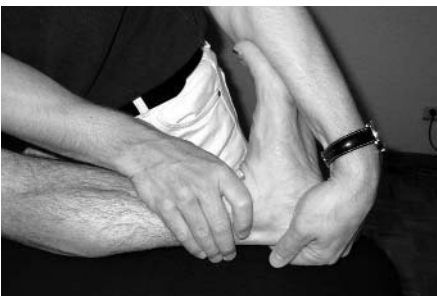
Abb. 7: Passiver Beweglichkeitstest, Extension linker Fuß