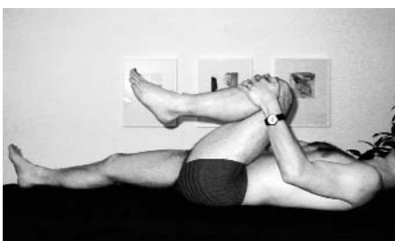
Abb. 17: Basisbewegung 3 Rückenlage, max. Hüftflexion, unilateral, verbesserte Flexion, li.

Die Muskelfunktionskette der Beuger entspannt sich und die Abduktion der rechten Schulter mit Lordosierung der LWS ist möglich (Abb. 18).