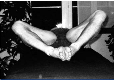
Abb. 5: Basisbewegung 2 Rückenlage, max. Abduktion, links eingeschränkter als rechts