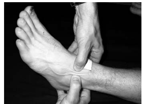
Abb. 15: Frontaltechnik, Kapsel OSG, linker Fuß, lateral

Spannung, was mir der Patient als merklich nachlassenden Schmerz bestätigte. Ich löste in 4-5 Sitzungen die Verklebungen um das linke obere Sprunggelenk.