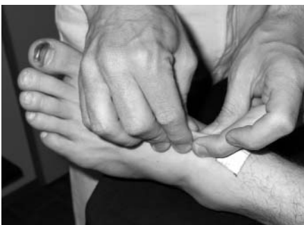
Abb. 12: Hautfaltentest am linken Fußrücken

Die Angaben des Patienten in der Anamnese wurden durch das Ergebnis des Hautverschieblichkeits- und Hautfaltentests und den Translationsbefund des linken oberen Sprunggelenks bestätigt. Ebenso waren die Basisbewegungen II und III der linken Hüfte nicht endgradig möglich. Die entzündungsbedingten Verklebun-