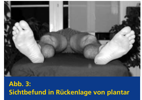
Abb. 3: Sichtbefund in Rückenlage von plantar

Patient in Rückenlage, beide Arme werden in die Anteversion gebracht. Der Patient gibt Schmerzen in der rechten Schulter ab einem Winkel von