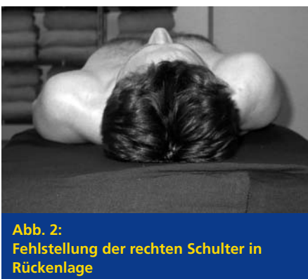
Abb. 2: Fehlstellung der rechten Schulter in Rückenlage

In Rückenlage zeigte sich die Fehlstellung der rechten Schulter aus der kranialen Perspektive ebenfalls ausgeprägt (Abb. 2). Die Grundspannung des rechten Trapezius war hoch. Das linke Knie zeigte ein Extensionsdefizit von 10°. Der linke Fuß befand sich 50° in Plantarflexion, mit leichter Inversion.