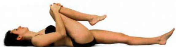
Abb. 3: Maximale Beugefähigkeit der Hüftgelenke. Hüftflexion statt Kyphose