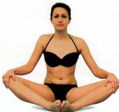
Abb. 2: Maximale Spreizfähigkeit der Hüftgelenke. Sie ist die Bedingung für das Kippen des Beckens.