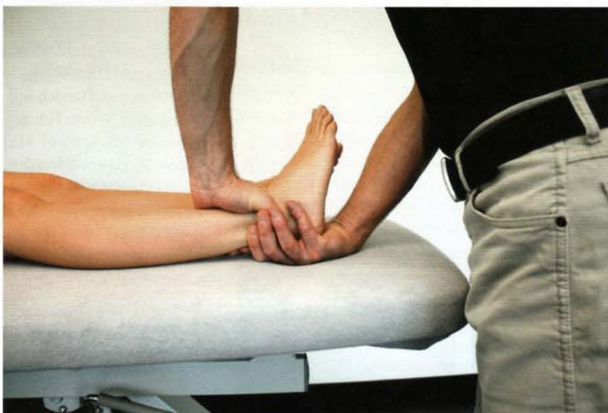
Abb. 6: Diagnostik der Füße

Mit diesem Beispiel soll verdeutlicht werden, wie entscheidend der Therapieaufbau von caudal nach cranial sein