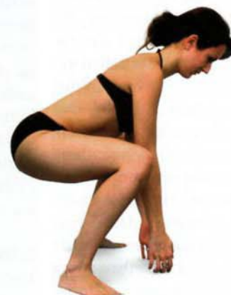
Abb. 4: All-in-One: Die drei Basisbewegungen finden sich als Kombination beim rückengerechten Bücken wieder. Sie sind Grundvoraussetzungen einer physiologischen Haltung